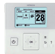
sterownik przewodowy standardowy z programatorem tygodniowym